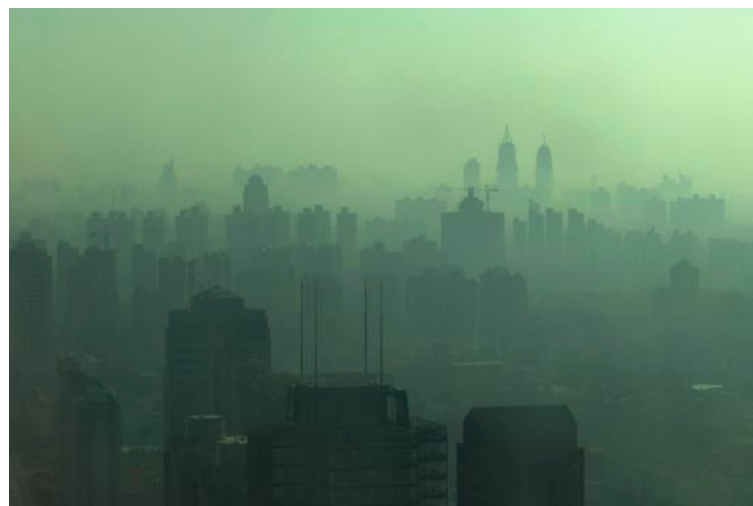
Kampf gegen den Smog: China will den Ausstoß von Schadstoffen eindämmen und muss dazu Technologien aus Hocheinkommensländern wie Deutschland importieren.

triebenen Wachstum ändern sollte.“ Er sei daher sehr froh über die Entscheidung der chinesischen Regierung.